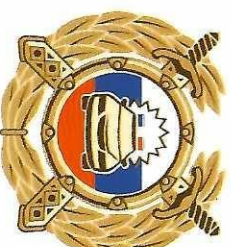
Госавтоинспекция МВД России

Бюджет подготовлен по заказу Минпросвещения России в рамках реализации федеральной целевой программы «Повышение безопасности дорожного движения в 2013–2020 годах».